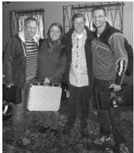
Mannschaft "Ginnheim 1"