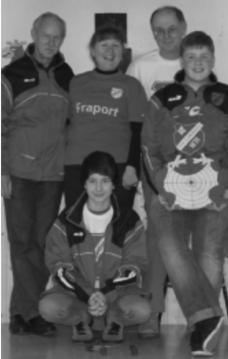
Mannschaft "Ginnheim 2"