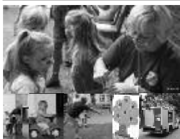
Schminken, Klebern, Spritzen, Babyparcours mit Bobby-Cars und Spiele für die Erwachsenen

130 Jahre TSV Ginnheim – Sommer- und Kinderfest