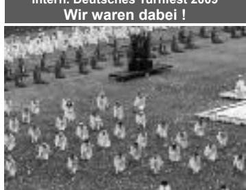
IDTF Abschlusßgala: Bahrvorführung der Gymnastik-Damen vom TSV Ginnheim und ...

Intern. Deutsches Turnfest 2009 Wir waren dabei !