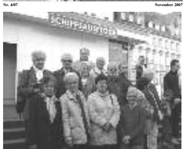
Für den Club 05 Plus heißt es Mitte Oktober „Lernen los, wir stechen in See“ (Foto: Am Essemen Steg)

Bauersfeld Chöre , 10.11.07 Ordensfest des TSV, 11.11.07, 11:11 Uhr Dart Bundesliga, 12.01.08