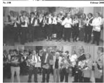
Der TSV-Chor hat bei der Ehrung von Vereinsmitgliedern zum Neujahrsempfang am 18. Januar 2008

Bauersfeld Chöre , 10.11.07 Ordensfest des TSV, 11.11.07, 11:11 Uhr Dart Bundesliga, 12.01.08